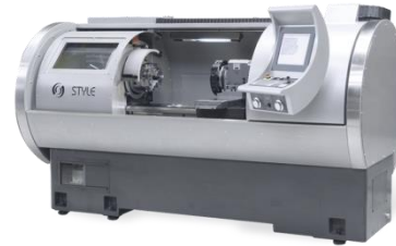
voorbeeld van een "nieuwe" draaibank