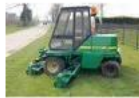
voorbeeld van een "nieuwe" kooimaaiër