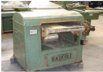
voorbeeld van een "oude" vandiktebank

Machinale houtbewerking is een activiteit, die traditioneel in SW bedrijven voorkomt en waarbij veelal lawaai wordt geproduceerd. Vrijwel alle machines op een dergelijke afdeling produceren een dusdanig geluidsniveau, dat altijd gehoorbescherming moet worden gedragen. Desondanks moet bij de bestrijding van schadelijk lawaai en overlast door lawaai altijd de arbeidshygiënische strategie worden gevolgd (zie hoofdstuk 7 van deze deelcatalogus). Hieronder worden een aantal oplossingen aangegeven om lawaai en overlast door lawaai bij machinale houtbewerking te beperken.