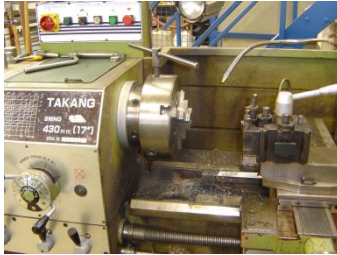
voorbeeld van een "oude" draaibank

Metaalbewerking is een activiteit, die traditioneel in SW bedrijven voorkomt en waarbij veelal lawaai wordt geproduceerd. Bij vrijwel alle activiteiten, die op een dergelijke afdeling worden uitgevoerd, wordt een dusdanig geluidsniveau geproduceerd, dat altijd gehoorbescherming moet worden gedragen. Desondanks moet bij de bestrijding van schadelijk lawaai en overlast door lawaai altijd de arbeidshygiënische strategie worden gevolgd (zie hoofdstuk 7 van deze deelcatalogus). Hieronder worden een aantal oplossingen aangegeven om lawaai en overlast door lawaai bij metaalbewerking te beperken.