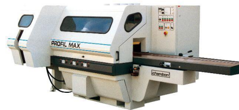
voorbeeld van een moderne 4-zijdige schaaftbank