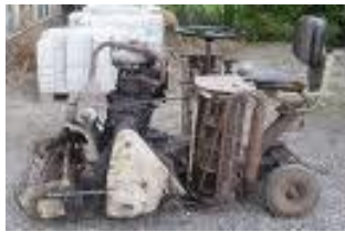
voorbeeld van een "oude" kooimaaiër

Groenvoorziening is een activiteit, die door veel SW bedrijven wordt uitgevoerd voor gemeenten, particulieren en bedrijven. Bij een aantal werkzaamheden in deze sector is er sprake van lawaai en lawaai-overlast, zowel voor machinebedieners, collega's en omstanders. Bij de bestrijding hiervan moet altijd de arbeidshygiënische strategie worden gevolgd (zie hoofdstuk 7 van deze deelcatalogus). Hieronder worden een aantal oplossingen aangegeven om lawaai en overlast door lawaai bij werken in het groen te beperken.